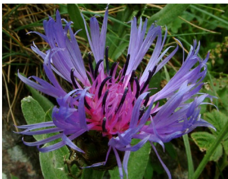
Ed.resp.: Vermeylen Jan

Les cotisations sont à verser au compte BE71 7320 3610 5269 en mentionnant le nom de l'affilié dans la communication.